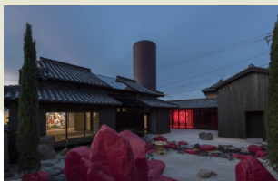
豊島横尾館

エスポワールパークに宿泊されるお客様限定。 豊島美術館、豊島横尾館、針工場を スタッフと一緒にご鑑賞いただき、 アートに触れながら、豊島の刻一刻と変化する 風景をお楽しみいただけるプログラムです。 豊島での滞在時間を、普段みることのできない 早朝や夜の美術館鑑賞にあててみませんか。