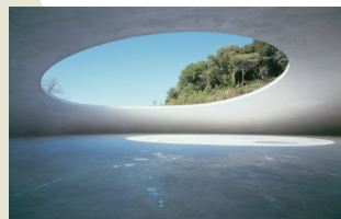
豊島美術館 内藤礼「母型」2010年